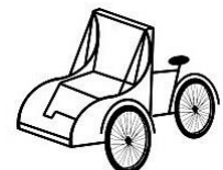
Przewóz Harcerską Rikszową Poczta Specjalną na trasie Urząd Pocztowy Wrocław 1 -Urząd Pocztowy Wrocław 32